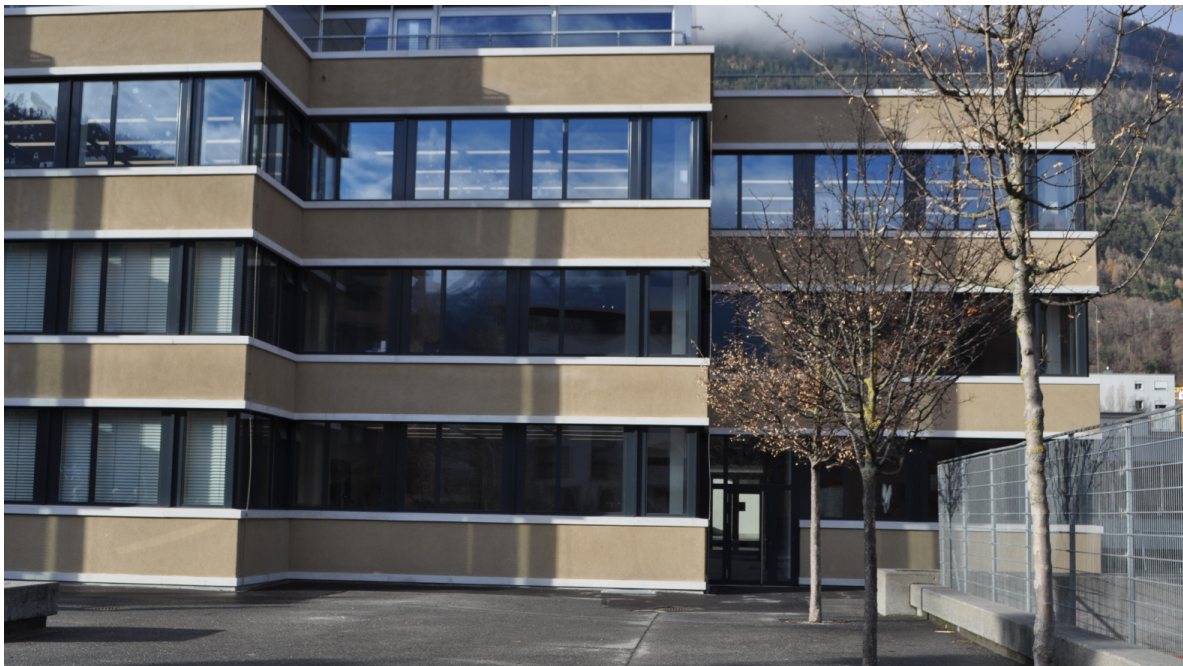
Abbildung 1: Gesamtansicht Schule Giacometti

Um für anstehende Schulsanierungen in der Schweiz belastbare Aussagen zu dezentralen Klassenlüftungen zu erhalten, hat die Stadt Chur eine sanierte Musterklasse errichtet und diese messtechnisch mit zwei Standardklassen verglichen.