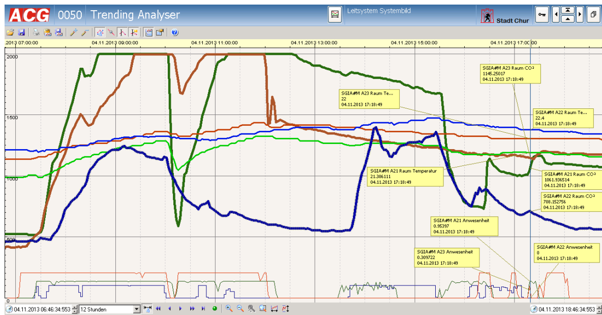
Abbildung 3: A21, grün: Referenzklasse A21 links, blau: Musterklasse A22, rot: Referenzklasse A23 rechts

Quelle: Hochbaudienste, Stadthaus, Masanserstrasse 2, Postfach 64, 7002 Chur „Schlussbericht Musterschulzimmer Giacometti“